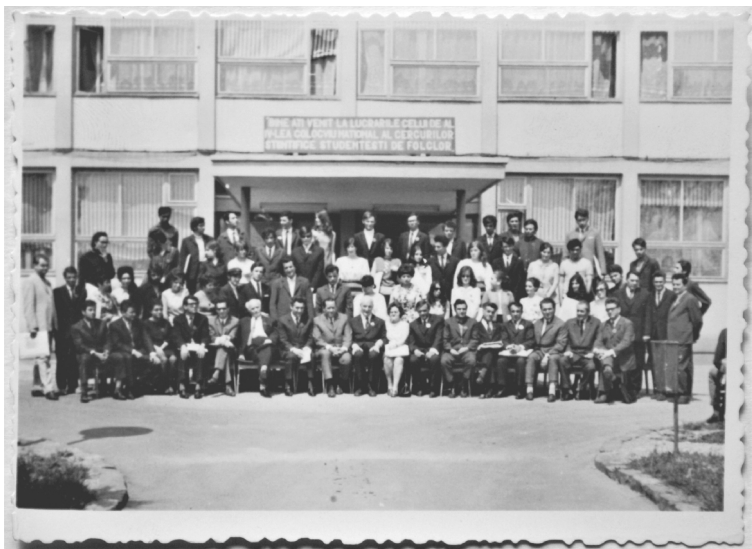
Al IV-lea Colocviu Național al Cercurilor Științifice Studențești de Folclor, Baia Mare, 13-16 mai 1971